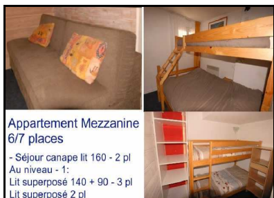
Appartement Mezzanine 6/7 places

- Séjour canapé lit 160 - 2 pl Au niveau - 1: Lit superposé 140 + 90 - 3 pl Lit superposé 2 pl