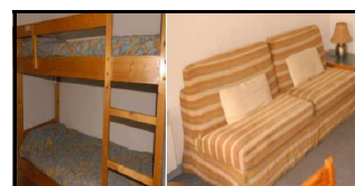
Studio 4 places - MARMOTTES Séjour canapé lit 140 - 2 Places Coin montagne: lit superposés 2 pers