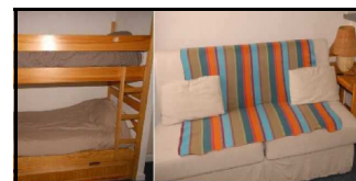
Studio 4 places - MARMOTTES Séjour canapé lit 140 - 2 places Coin montagne: lit superposés - 2 pers