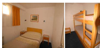
Appartement 2 pièces 6 places